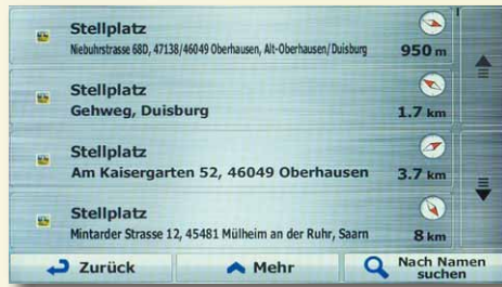
... findet sich eine Riesenauswahl an Stellplätzen