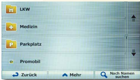
Unter der POI-Kategorie „Promobil“ ...