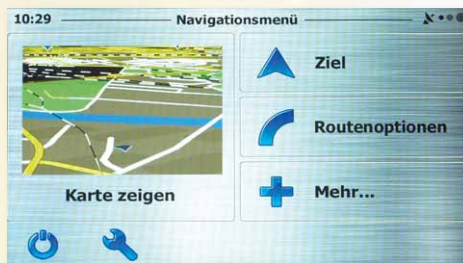
Bekanntes Bild: Navigation iGo Primo